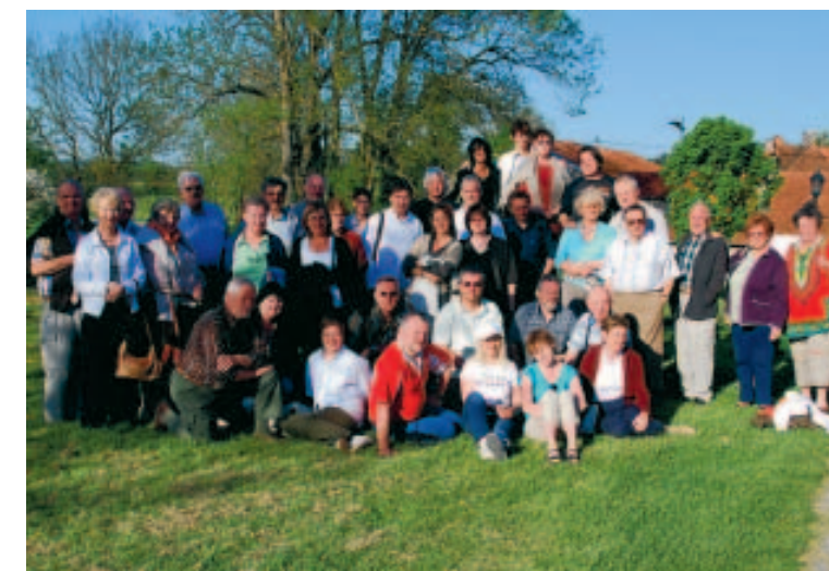
La photo de groupe du dernier voyage de la Baronnie liégeoise. ■ D.H.

Le fier Castel de Suze-la-Rousse, siège de la Commanderie, sert de cadre à des manifestations souvent fastueuses à l'occasion de l'intronisation d'éminentes personnalités venues de tous les horizons. Mais c'est surtout vers l'étranger que la Commanderie porte ses efforts. À l'heure actuel-