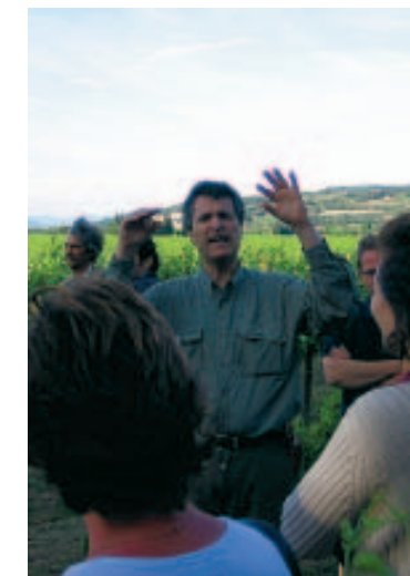
Le partage d'une passion. ■ P.M.

Les vigneron des Costes du Rhône ont le cœur sur le vin et les écouter vous donne déjà l'ivresse de l'amitié. «